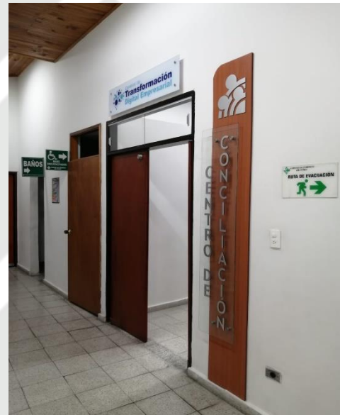
ÁREA DE ESPERA: